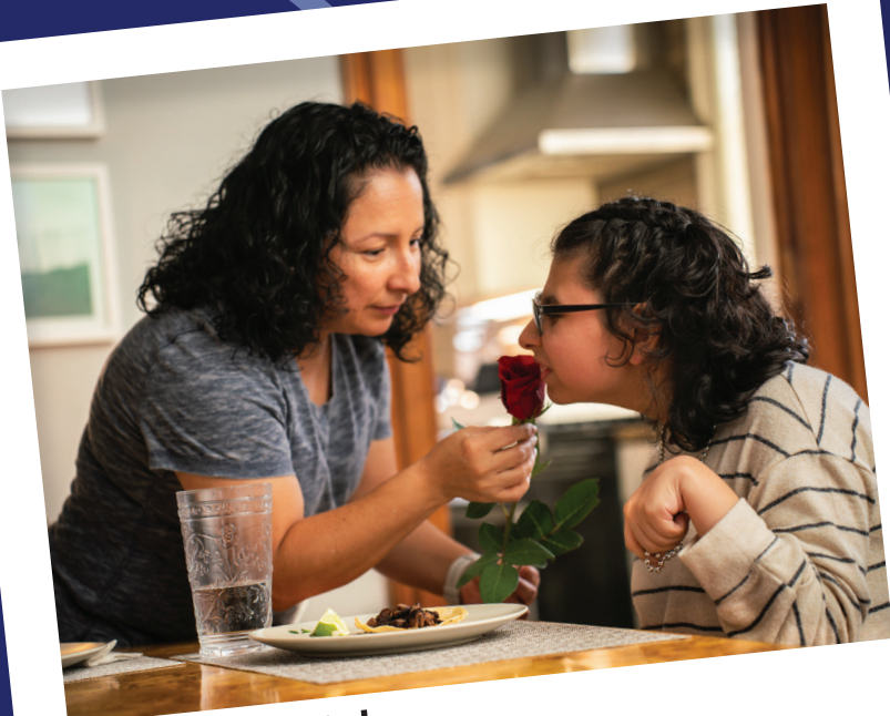
Ere y Ashley